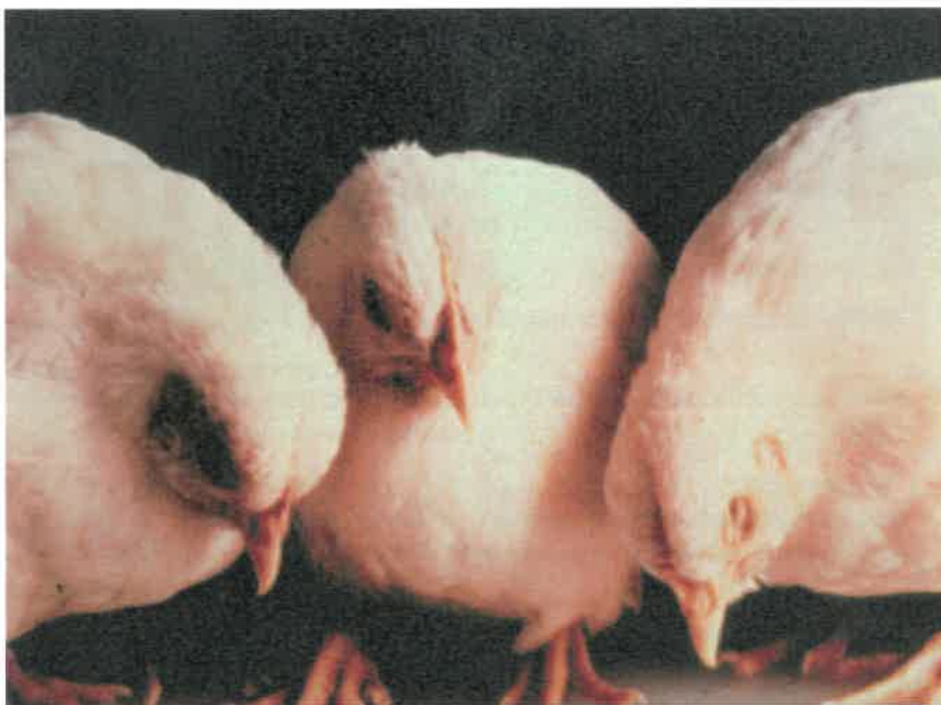
Пилета, заболели от птичи грип с оток на главите.

Заболелите от инфлуенца птици са с разрошени пера, омърлушени, липсва апетит, установява се намалено яйценосене, посиняване и оток на гребена и менгушите или цялостен оток на главата. Проявяват тежки увреждания на дихателната система — кихане, кашлица, хрипове, изтечения от очите, диария, нервни признаци, парализа и смърт.